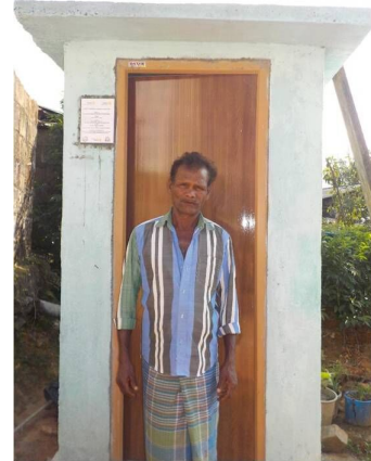
Upcountry Sanitation project at Mayfield Estate – September 2018

Livelihood/Resettlement Assistance – Livelihood projects with provision of boats, engines and nets for resettled families in Sampoor and other areas in the North and East collaborating with mainly Assist RR, a UK Charity. Resettlement assistance in Kancharamodai for families with basic supplies, sanitation and water. Plans include providing livelihood support.