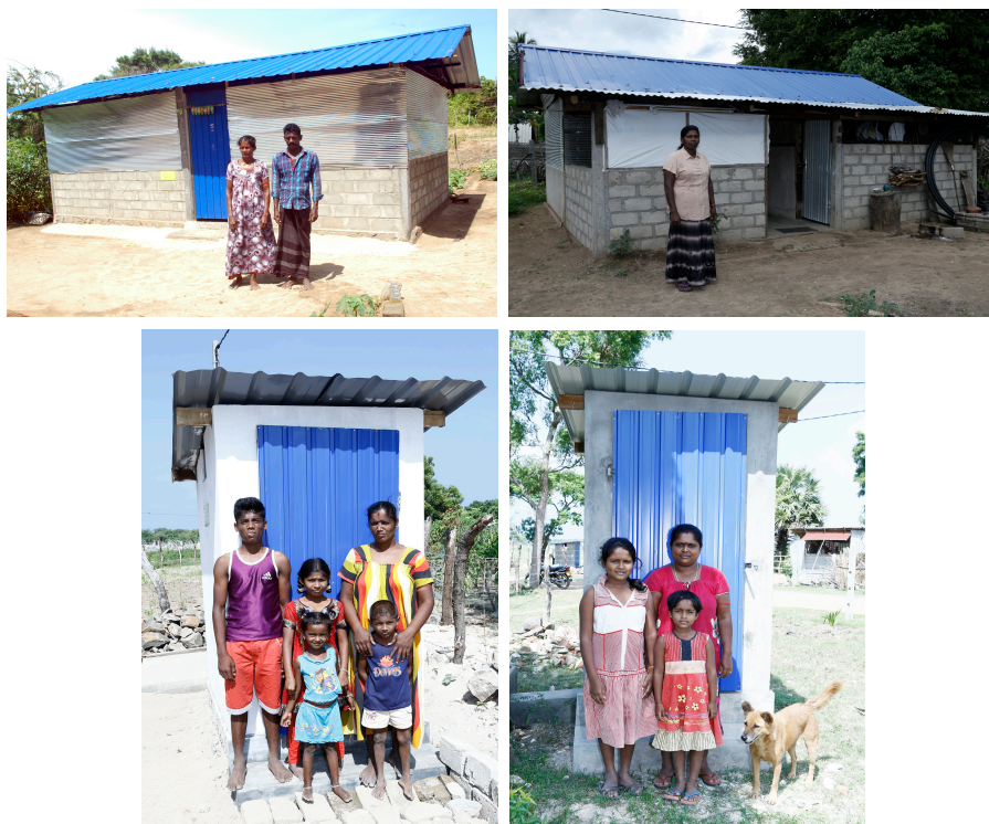
Shelters & Toilets funded by IMHO USA in Sampoor

Families are now living in acceptable, safe and decent semi-permanent shelters without the need to worry about flooding, weather and threat from animals. IMHO and its supporters made a significant contribution to improve the living conditions of Sampoor IDPs. Assist RR Would like to express its gratitude to IMHO USA and Canada for their timely assistance. It should be noted that these families have been extending their shelters and have made them in to proper homes. Please see a photo below. Assist RR are willing to facilitate if IMHO's benefactors want to visit Sampoor and see these shelters in person.