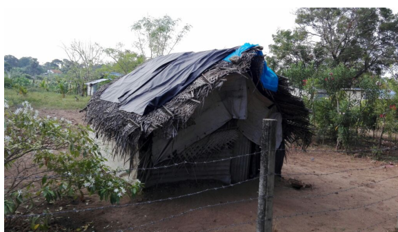
Living Conditions during Resettlement