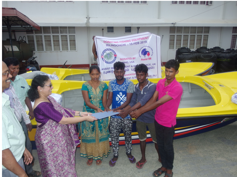
Boats handing over ceremonies in Batticaloa, Jaffna & Kilinochchi