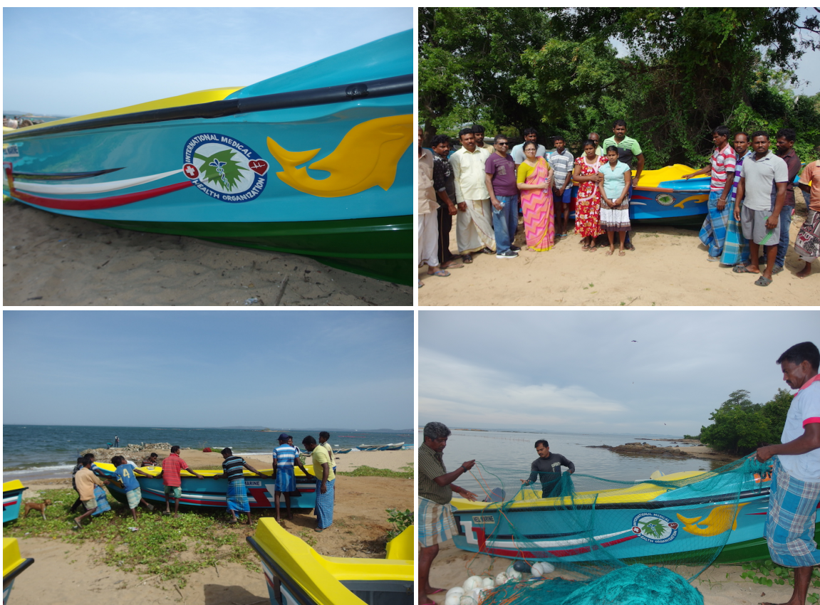
Engine boats and nets donated by IMHO USA to Sampoor fishing families

IMHO USA again came forward and agreed to fund 10 engine boats and nets at a cost of around $3750 per set. Five fishing families are sharing one engine boat and nets. Feedback from these families is very positive. They told that they are able to stand on their own feet and earning enough to feed their families and to look after their other needs including children's education. Without IMHO USA's assistance, these 50 families may still struggle to make ends meet. This assistance had significantly improved the lives of these 50 fishing families. Photos are given below.