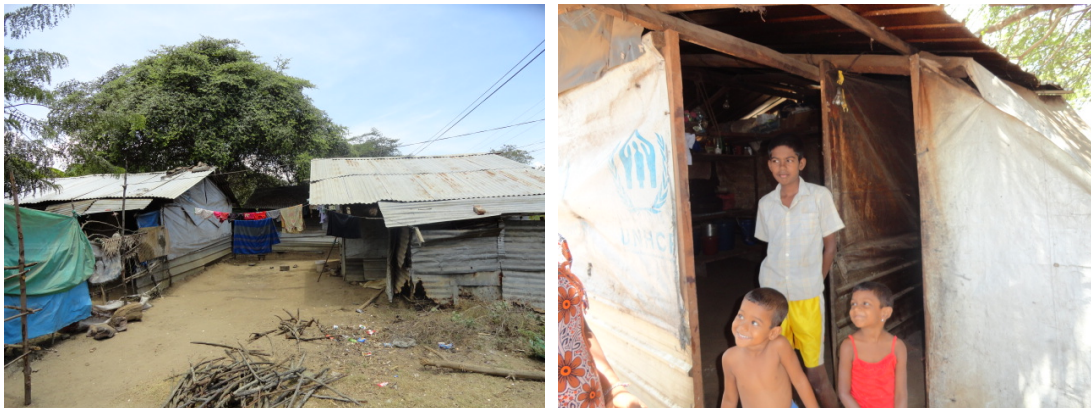
Living condition of Sampoor IDP in welfare centres

People from Sampoor in Trincomalee district were displaced in 2006 following the war and were languishing in four welfare centres (or refugee camps around Sampoor). Nearly 1250 families were displaced and around 900 families were living in the welfare centres. See photos below for their living conditions. Most of these families were successful farmers and were financially sound. However, following displacement, they have lost their livelihood and were struggling to survive.