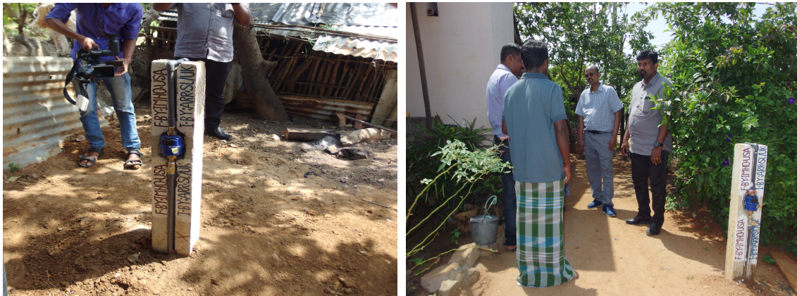
Water connections to households in Paadalipuram

fulfill his promise. At the end, we are forced to provide the connection at a cost of around Rs 14,500 ($85). IMHO USA has kindly agreed to provide water connections to these 178 families at $85 per household. This assistance by IMHO USA will significantly improve the living condition of these less fortunate families. Assist RR would like to express its gratitude to IMHO USA and its supporters for their continued support to the needy in Sri Lanka. Photos are given below.