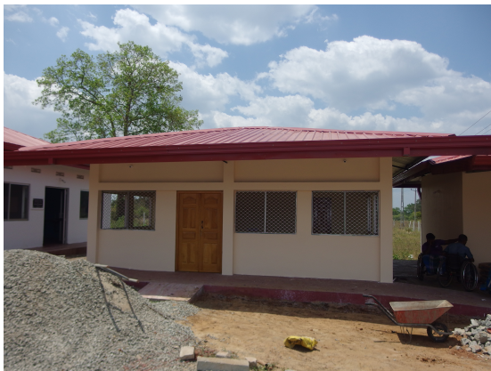
Treatment Centre Building at Uyirilai in Mankulam funded by IMHO USA