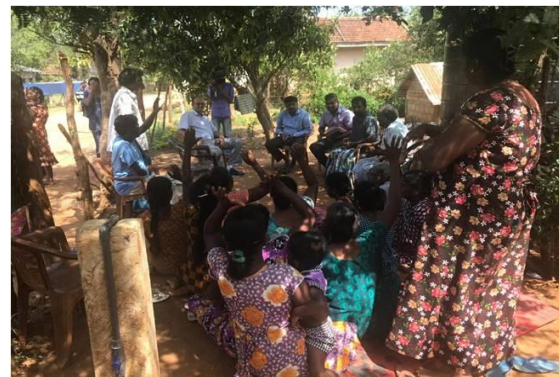
IMHO Treasurer meeting with beneficiary families of the Paadalipuram water supply project – February 2019

IMHO is a registered tax-exempt, 501(c)3 non-profit, charitable organization in the United States (Federal Tax ID #: 59-3779465). IMHO is a registered Private Voluntary Organization (PVO) with the United States Agency for International Development (USAID), and a proud member of InterAction.