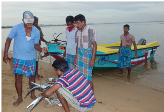
Sampoor livelihood project for fishing families – 2018