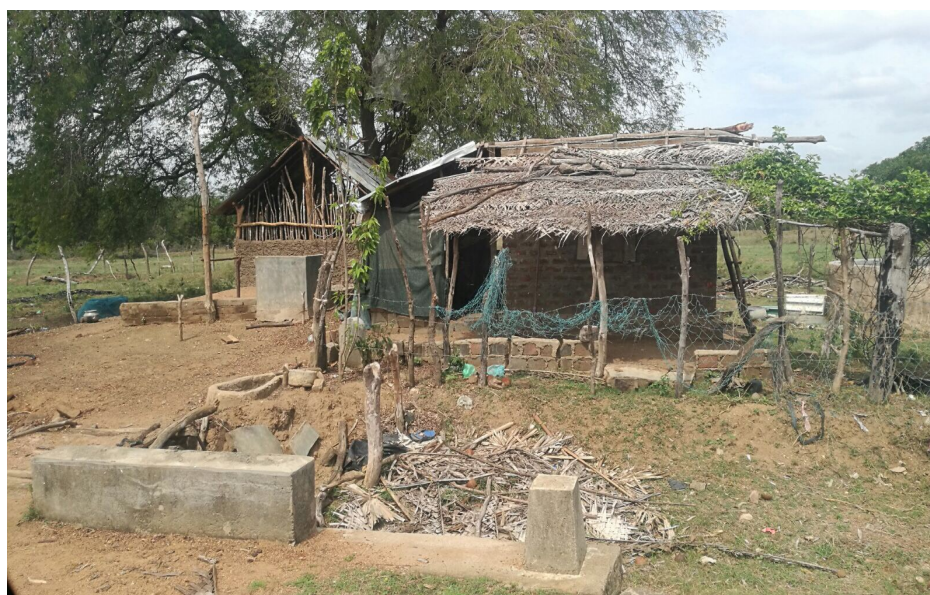
Typical shelter of Adivasi families in Muthur

Nearly 1600 families from 11 villages in Muthur, where Adivasi families lived, were displaced in 2006 due to the war and became IDPs . They were resettled in 2009 in alternative lands as the Navy occupied their lands. Although they were promised all the facilities, they are living in very sad conditions. Their livelihoods are farming depending on rain, collecting honey and firewood, hunting, and fishing. However, the government has banned hunting, although they are hunters. These families are not given Samurthi hand outs yet, although all these families live below poverty lines. Since these families do not receive Samurthi handouts, they are not entitled to any government subsidies towards electricity connections or water supply to their households.